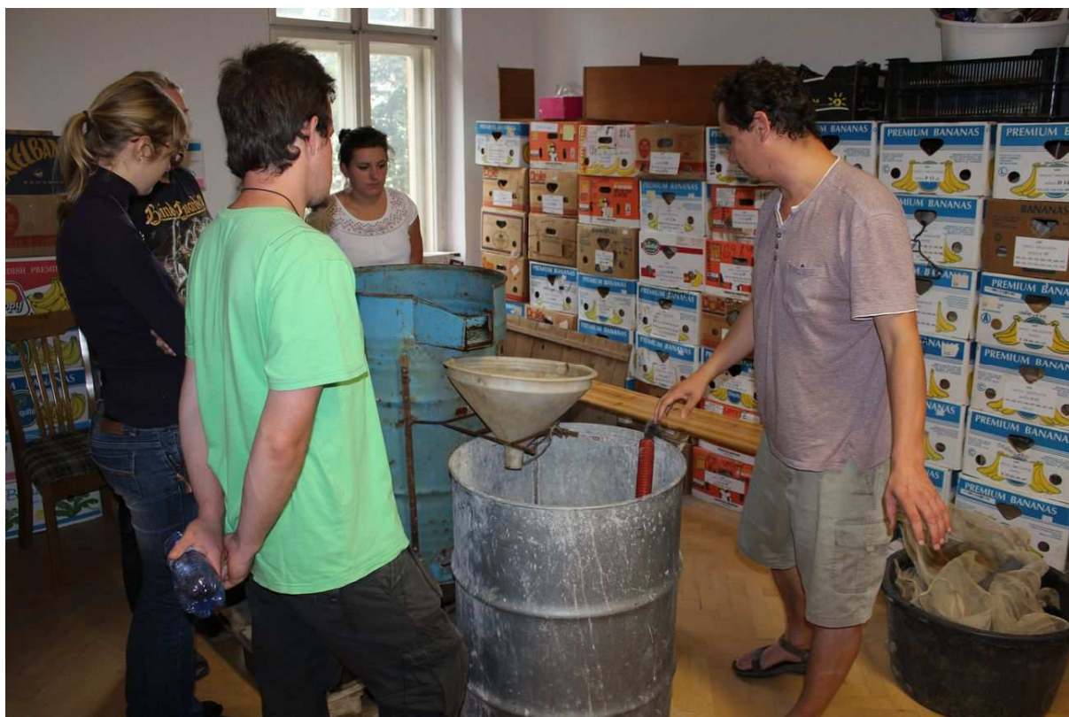
Obr. 2 – 3. Ukázka principu plavení.