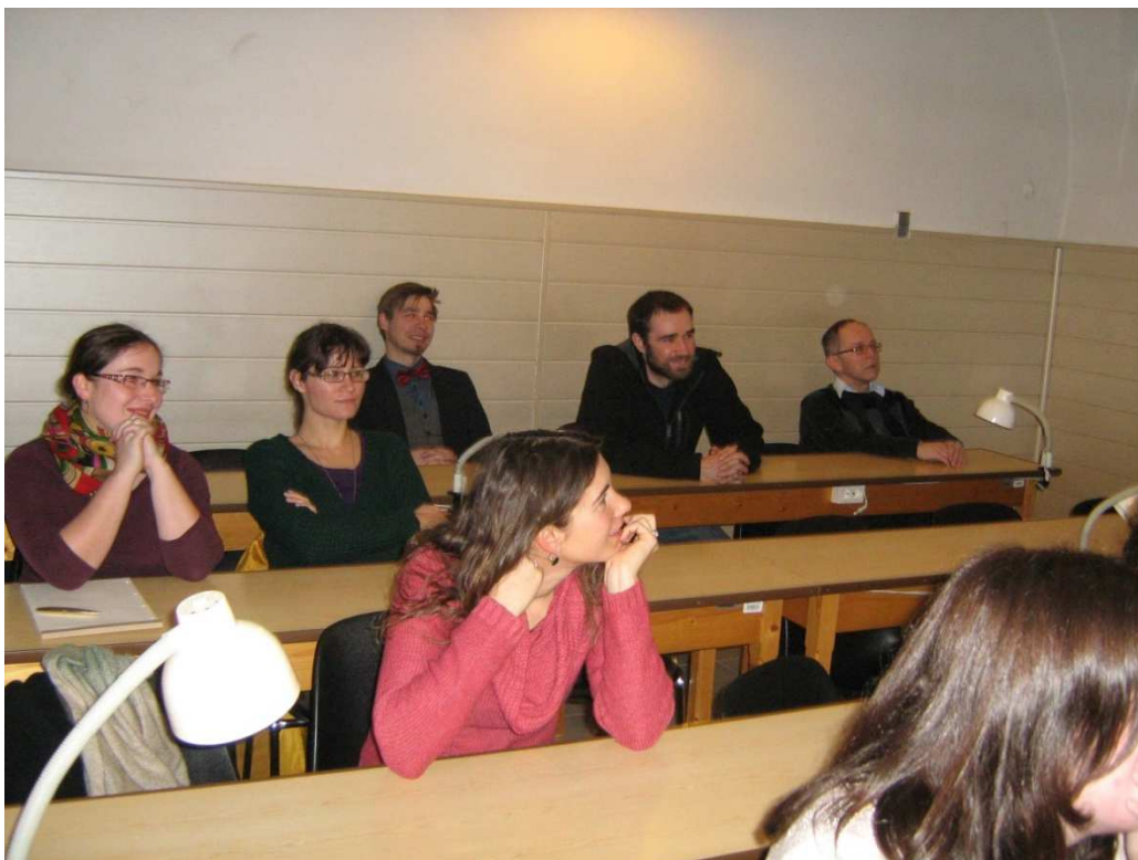
Obr. 1 Učebna Instytutu Archeologie Uniwersytetu Jagiellońskiego v Krakově