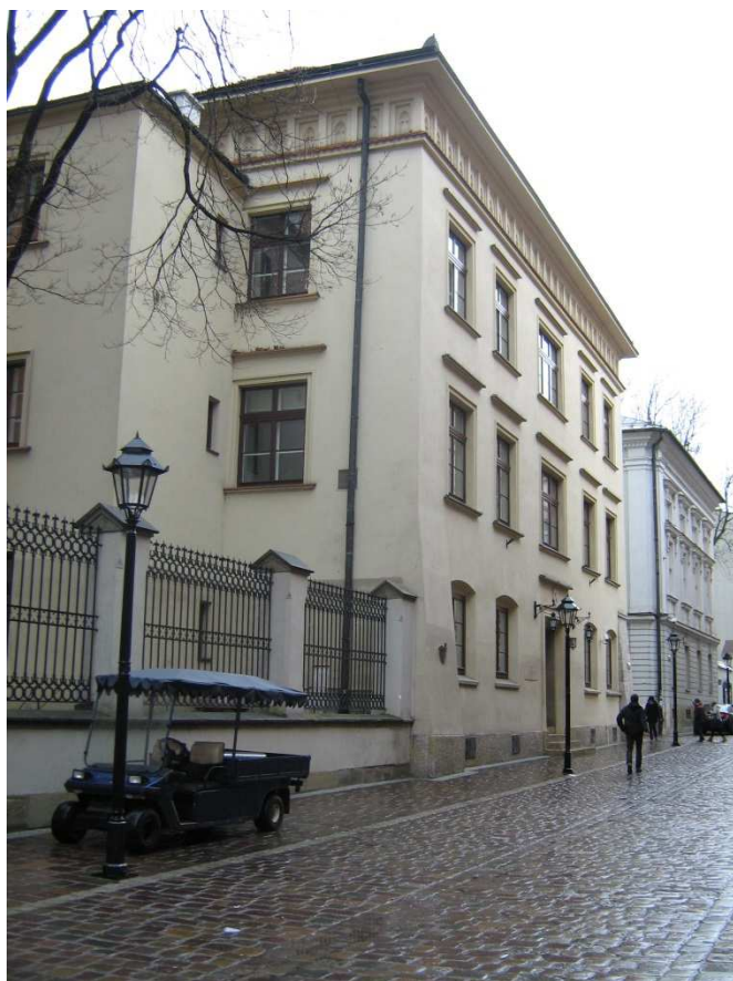
Obr. 1 Instytut Archeologii Uniwersytetu Jagiellońskiego v Krakově

Důležitou náplní exkurze byla také prezentace vědeckého záměru Ústavu archeologie Slezské univerzity v Opavě, který se v posledních letech věnuje zkoumání distribuce silicitu z oblasti Krakowsko Częstochowske jury do prostoru Oderské brány. Cílem bylo především navázat vědeckou spoluprací s kolegy, kteří tuto oblast velice dobře znají a mohli by poskytnout důležité informace o exploataci této suroviny.