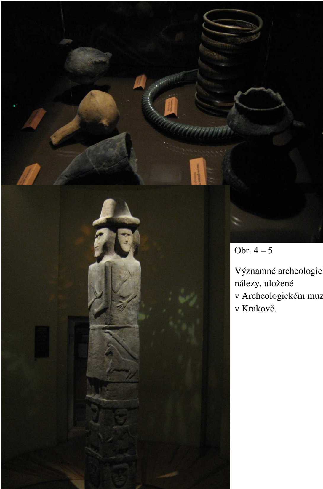
Obr. 4 – 5

Významné archeologické nálezy, uložené v Archeologickém muzeu v Krakově.