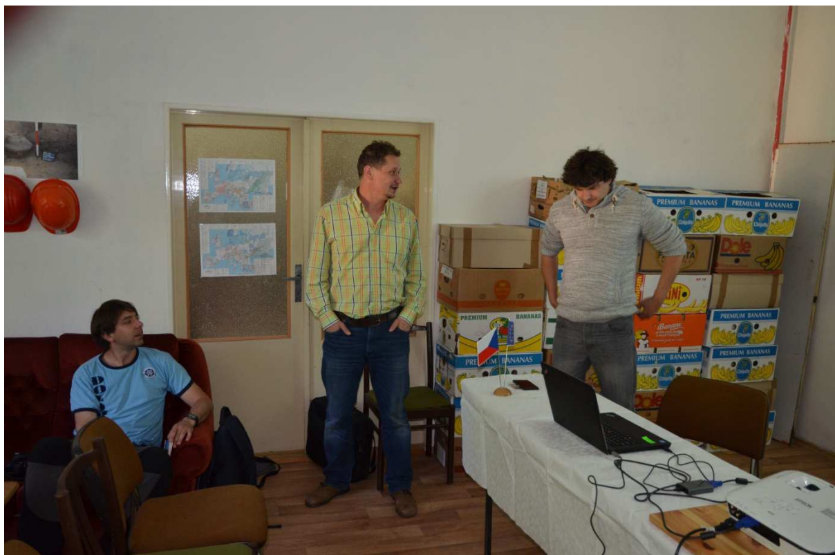
Obr. 2 Oficiální uvítání hostů