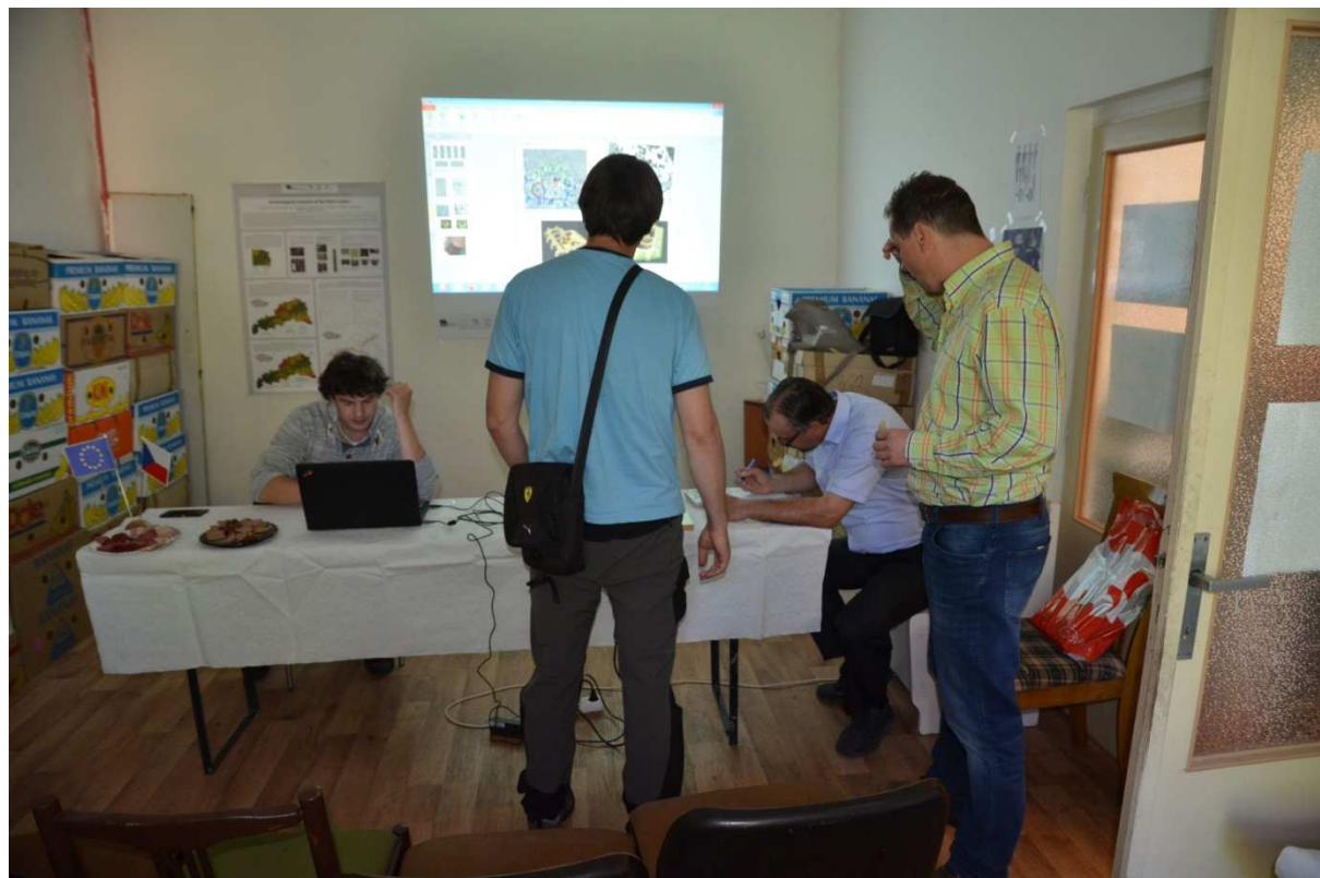
Obr. 1 Příprava workshopu