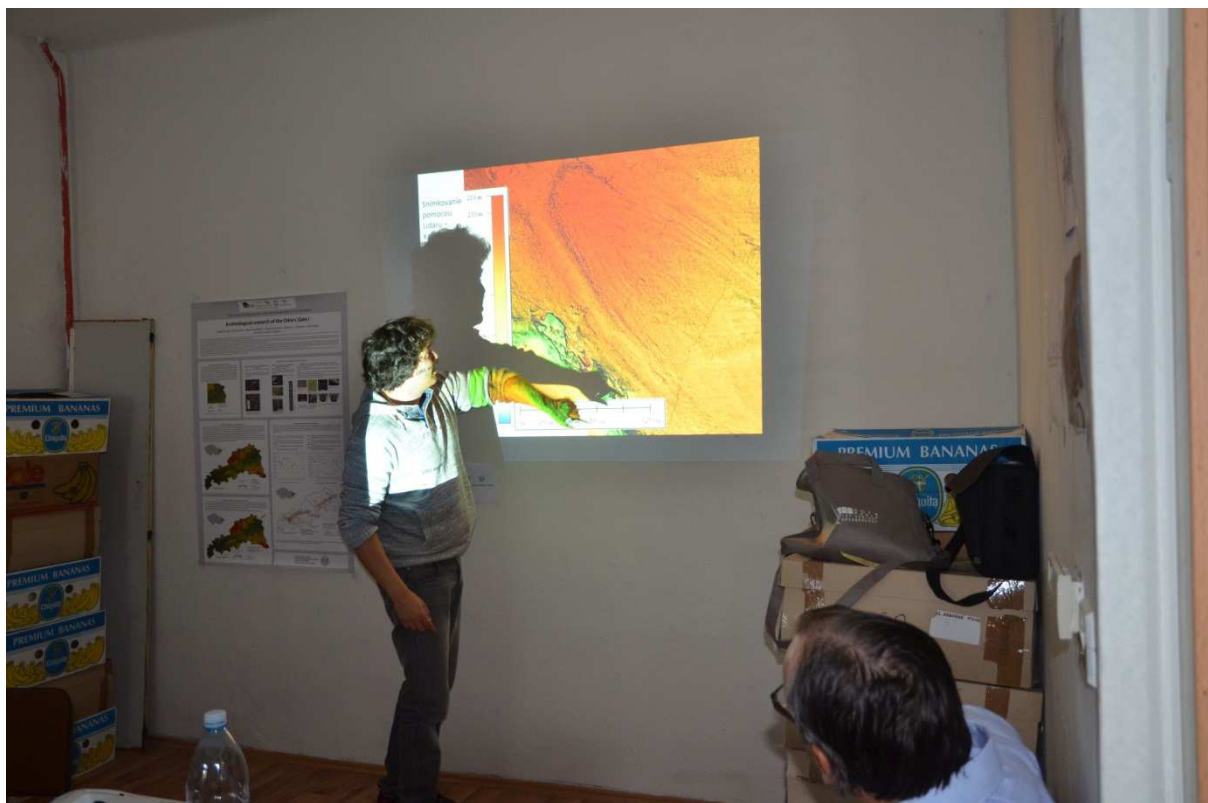
Obr. 4 Ukázka praktického využití geofyzikální metody v průzkumu krajiny