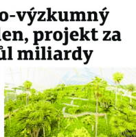
KARVINÁ EDEN SILESIA Vizualizace ukazuje, jak by mohly vypadat území vědecko-výzkumného pracoviště Eden v Karvině. Ilustrace: Fiala Architects a MSK

OTEVŘENÍ V ROCE 2028 Pokud projekt podporu získá, měly by být do konce roku 2025 hotové projekční práce a v letech 2025 až 2027 se má budovat. S otevřením areálu