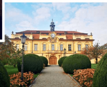
Libeňský zámek se 25. června 1608 stal místem, kde se rozpůlila naše země.