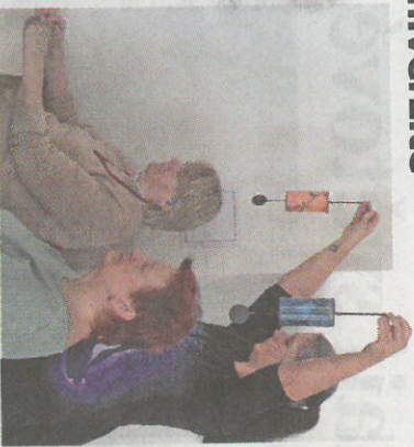
Na seniory čekal zajímavý a originální program.