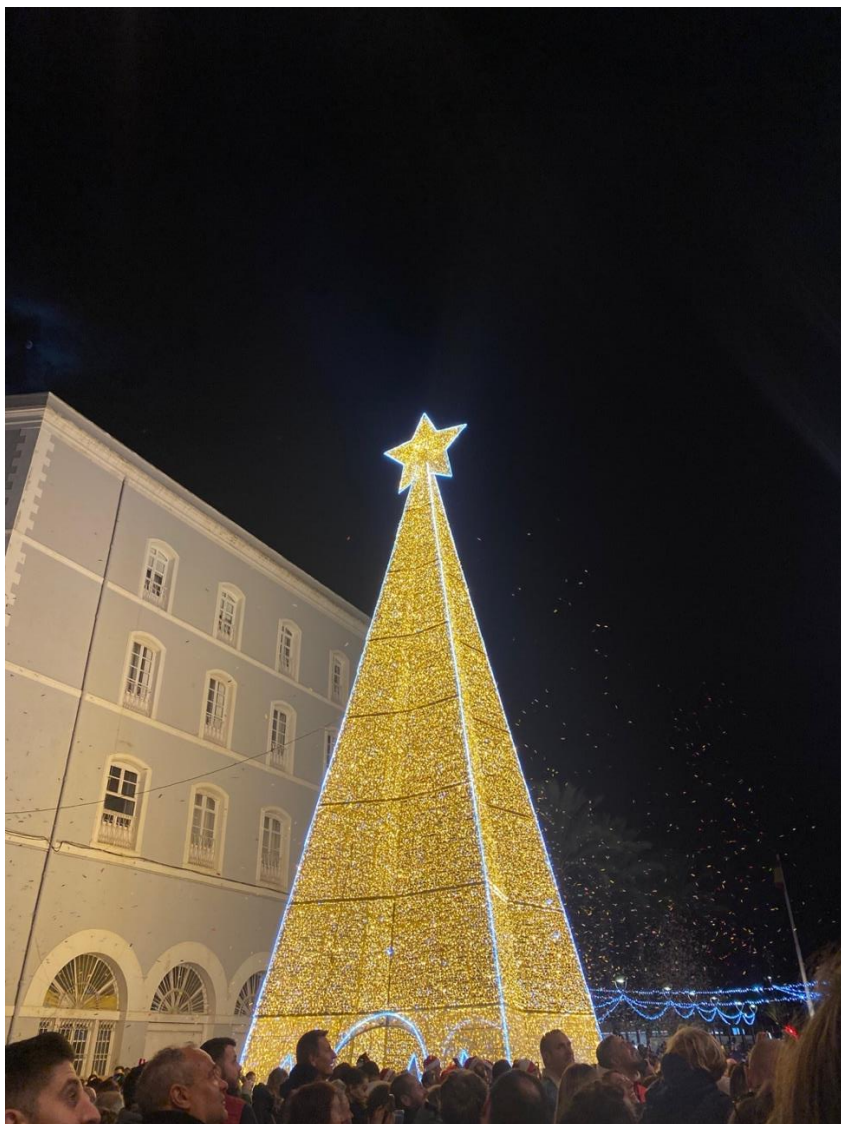
Rozsvícení vánočního stroměčku v Cartageně