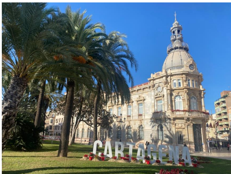
Výhled z knihovny