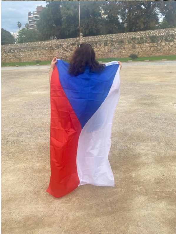
ESN International Event ve Valencii