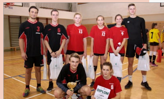
▲ 1. Gymnázium a Obchodní akademie Orlová

Zlatý pohár děkana fakulty získali studenti Gymnázia a Obchodní akademie Orlová, na druhém místě se umístili studenti Gymnázia Karviná, třetí místo patřilo studentům Obchodní akademie Český Těšín a na čtvrtém místě skončili studenti Střední průmyslové školy Karviná. Kromě pohárů obdrželi vítězi všech tří kategorií věcné ceny. Všem účastníkům děkujeme za úžasné sportovní výkony a skvělou atmosféru.