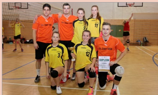
▲ 3. Obchodní akademie Český Těšín