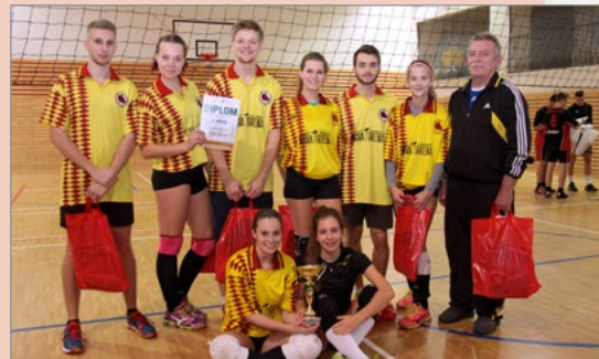
▲ 2. Gymnázium Karviná