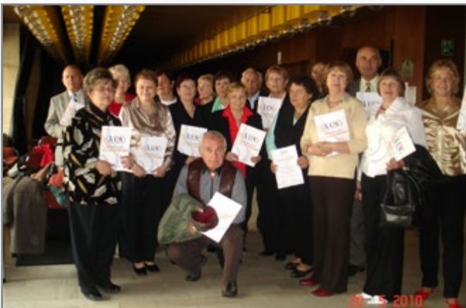
▲ virtuální univerzita třetího věku

Posluchači univerzity jsou lidé, kteří se chtějí i v pozdějším věku dále vzdělávat, orientovat se v dnešní společnosti, smysluplně využít volný čas, poznávat nové přátele a také zvýšit si prestiž v rodině a okolí. V současnosti se studium nezaměřuje pouze na čistě ekonomická témata, nýbrž je rozšířeno o nabídku studia dalších atraktivních vzdělávacích oblastí, např. historie, turistika či komunikační dovednosti. Témata jsou koncipována na základě průzkumu zájmu mezi účastníky univerzity třetího věku, a to formou dotazníkového šetření.