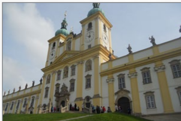
▲ Svatý Kopeček