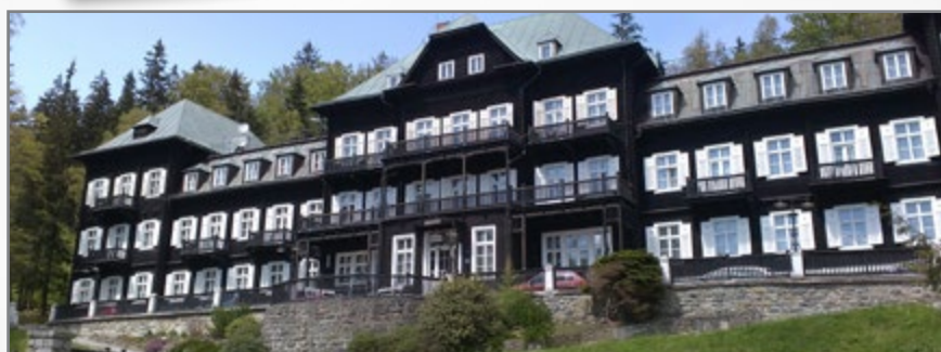
▲ Karlova Studánka