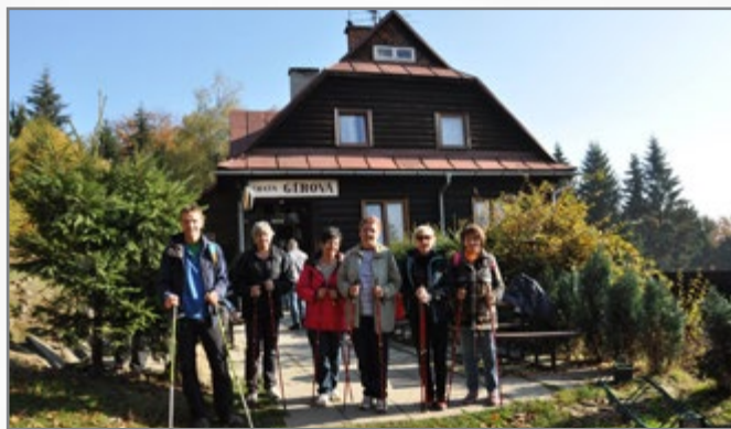
▲ Nordic Walking, chata Gírová