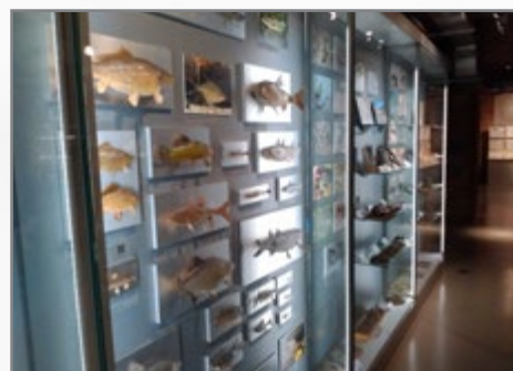
▲ Slezské muzeum Opava