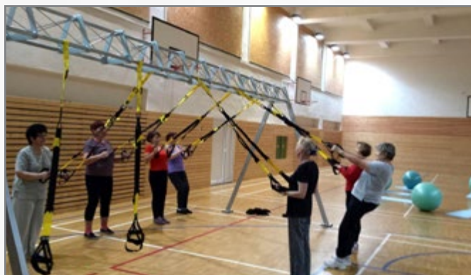
▲ závěsné pásy TRX

Dalším neobvyklým prvkem výuky bylo setkání v bazénu při akvaerobiku se studenty prezenčního studia. Obě skupiny si užily nejen příjemné pocity z pohybu, ale rovněž spousty vtipných momentů. Na základě dobrých zkušeností budou organizátoři U3V na fakultě nadále usilovat o zachování programů podobného typu nejen pro seniory, ale i pro širokou veřejnost.