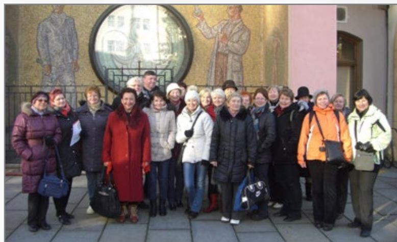
▲ Adventní Olomouc