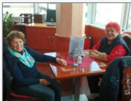
▲ restaurace R818 v 18. patře