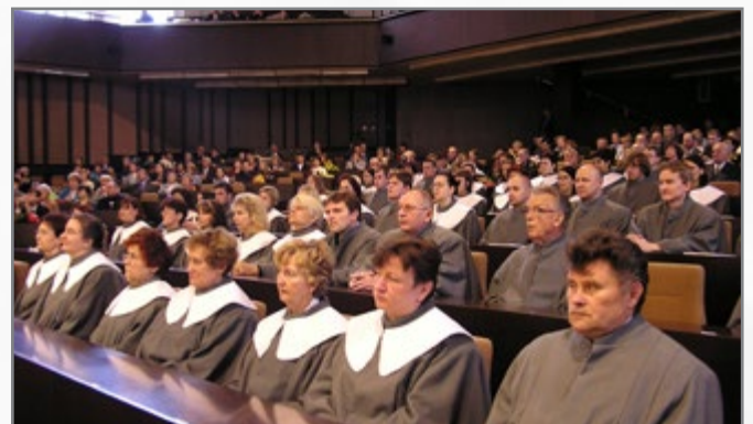
▲ předávání osvědčení