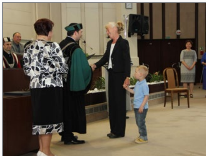
▲ předávání osvědčení

A na co se mohou posluchači těšit v příštím akademickém roce? Nabídka, ze které budou vybírat, je tentokrát opravdu bohatá a pestrá. Poprvé v historii karvinské univerzity budou nabízené témata zaměřená na gastronomii a nápojovou kulturu. Dále se mohou vzdělávat opět v oblasti komunikačních dovedností a oblíbené přednášky s historickou tematikou budou tentokrát zaměřeny na příběhy evropských měst. V nabídce nebude chybět ani praktický přednáškový cyklus Finance a účetnictví pro život a praxi.