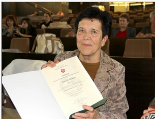
▲ předávání osvědčení

Součástí celoživotního vzdělávání je také Univerzita třetího věku (U3V), která má na Slezské univerzitě v Opavě, Obchodně podnikatelské fakultě v Karviné své stálé místo již 25 let. Základním posláním U3V je poskytnout zájemcům možnost seznamovat se na vysokoškolské úrovni s nejnovějšími poznatky z oblasti vědy, kultury, historie, politiky, apod. U3V také plní výraznou sociální funkci a motivuje seniory k další aktivitě.