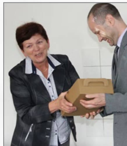
▲ předávání cen za nejlepší seminární práce