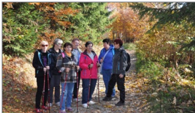
▲ Nordic Walking, chata Gírová