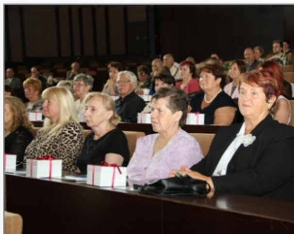
▲ předávání osvědčení posluchačům U3V