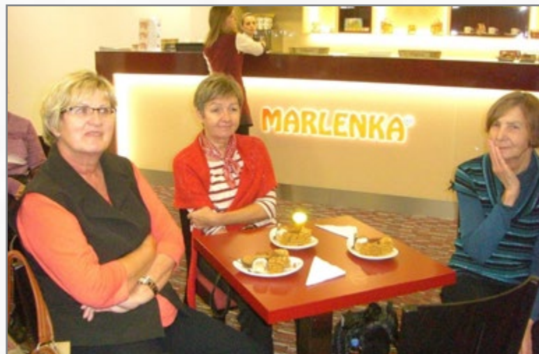
▲ továrna Marlenka