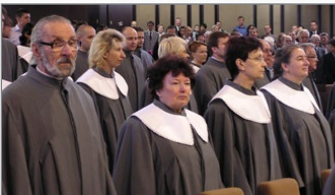
▲ předávání osvědčení

Četnému zájmu se mezi posluchači těší výuka cizích jazyků. Jejich motivací je nejen zvyšování kvalifikace u pracujících, ale také přání odstranit jazykovou bariéru při cestování aneb se naučit pouze něco nového.