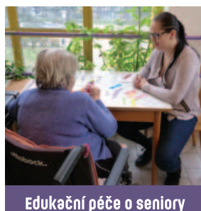
Edukační péče o seniory