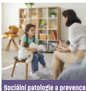
Sociální patologie a prevence