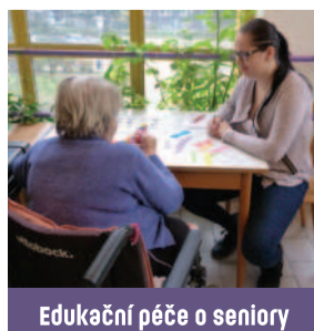
Edukační péče o seniory