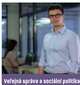
Veřejná správa a sociální politika