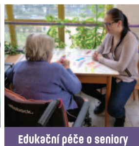
Edukační péče o seniory