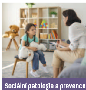
Sociální patologie a prevence