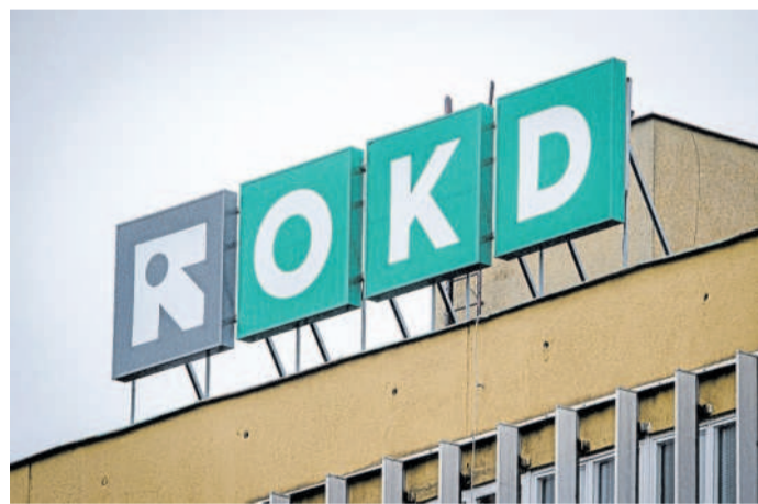
DOLY Darkov a ČSA ukončují těžbu.